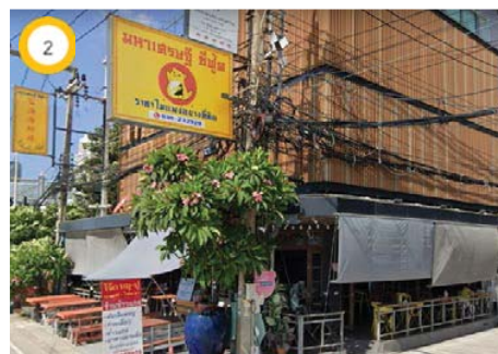
ร้านอาหารมหาเศรษฐีซีฟู้ด