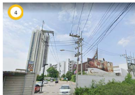
โรงแรม Centra by Centara Maris Resort Jomtien