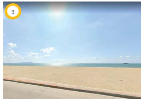
ถนนจอมเทียนสาย 1 และชายฝั่งทะเลอ่าวไทย