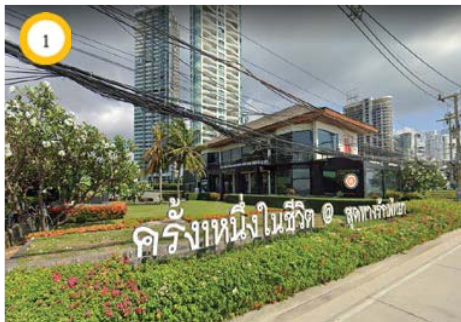
ร้านอาหารสดทางรักพทยา