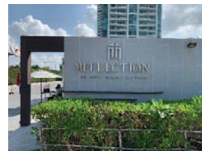
โครงการ Reflection Jomtien Beach Pattaya